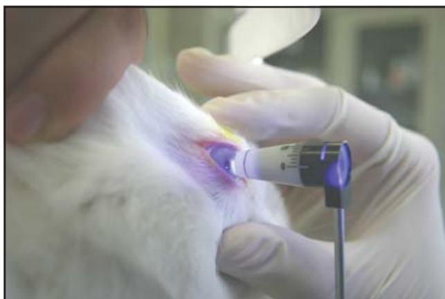
Fig. 1. Tonometría en la lámpara de hendidura.

Se calculó el promedio ± desviación estándar (DE) de la PIO, PIO máxima y mínima así como promedio ± DE de la PIO por horario AM y PM. Asimismo, las diferencias de PIO intraojo se calcularon en cada conejo obteniendo el valor absoluto de la resta de la PIO de OD menos OI. Las diferencias interobservador fueron analizadas mediante el coeficiente de correlación de Pearson.